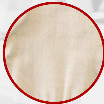
Soporte interior algodón