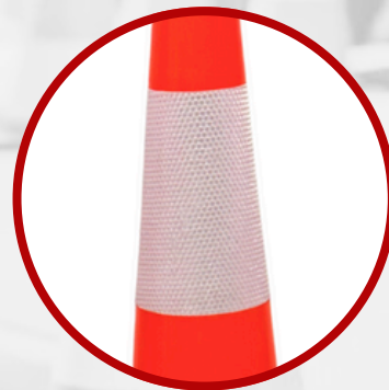
Cinta reflectante diamantada de 2"