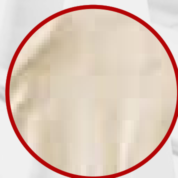
Interior de algodón